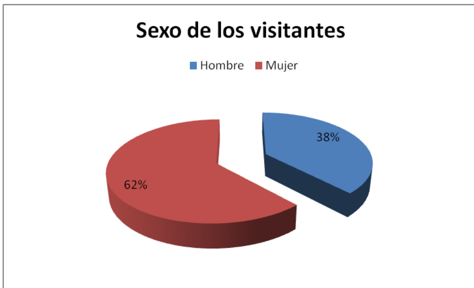
Gráfica 1: sexo de los visitantes a nivel regional.

corresponde al género femenino, esto es, 438 mujeres y 268 hombres que representan el 38%. En Perú 249 visitantes de los 374 fueron mujeres, es decir un 64.8% del total de participantes pertenece al género femenino. En Chile los porcentajes son muy similares pues el 62.9% corresponde al género femenino con 122 mujeres y un 37.1% pertenece al género masculino con 72 visitantes. En el caso de México el 50% representa al género masculino y el 50% restante al femenino. Bolivia tuvo una participación de 30 mujeres de un total de 54 visitantes lo que corresponde a 55.6%.